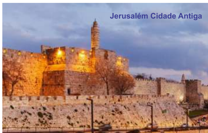
Jerusalém Cidade Antiga

Jerusalém: o Muro das Lamentações, o Monte do Templo, a Via Dolorosa e a Igreja do Santo Sepulcro. Continuar para o Monte Sião, que abriga o túmulo do Rei David, o Cenáculo e a Abadia da Dormição.