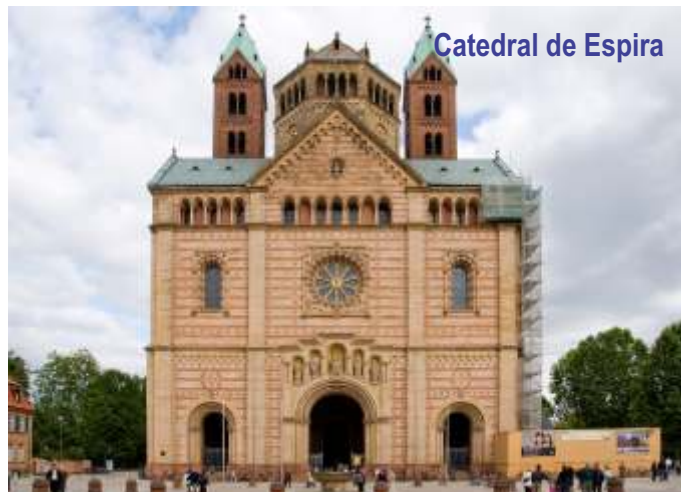
Catedral de Espira