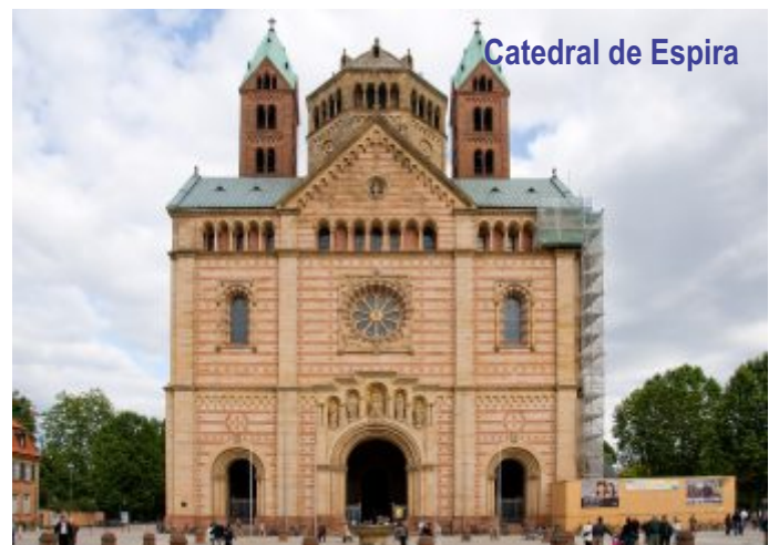
Catedral de Espira